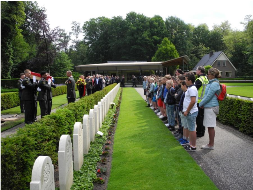
Grebbeberg te Rhenen.

Op 24 mei 2018 werden beide soldaten herbegraven op Ereveld de