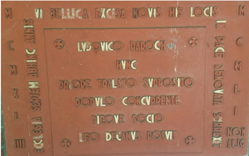
Eerste steen Melderslo 1951.