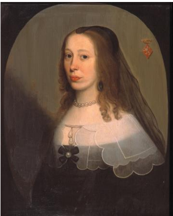
Figuur 2. Wilhelmina van Bronckhorst (†1672).