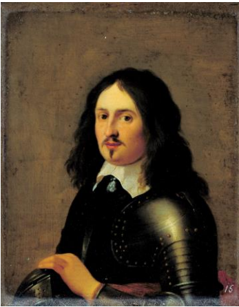
Figuur 1. Willem Vincent van Wittenhorst (†1674).

Het is overigens niet vreemd dat in een kerk meerdere grafkelders zijn, omdat er ook hoge geestelijken regelmatig werden begraven. Maar vier? De exacte plek van de crypte van de familie Van Wittenhorst blijft voorlopig dus een vraagteken. Hoewel dit na ruim een jaar onderzoek wellicht teleurstellend klinkt, is er ook positief nieuws. Alle informatie die we nu hebben, hoe weerbarstig, vol tegenspraken en versnipperd ook, wijst erop dat de crypte in de huidige kerk ligt. Ondertussen is ons onderzoeksgroepje bezig om financiën te zoeken om het geofysisch onderzoek alsnog te kunnen uitvoeren.