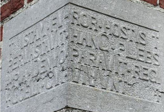
Eerste steen Sevenum.

Tekst: + IstaM fVror hostls + perVastaVIt hanC pLebs + pla DenVo paraVIt regl + CoeLI CVI VIVVnt +