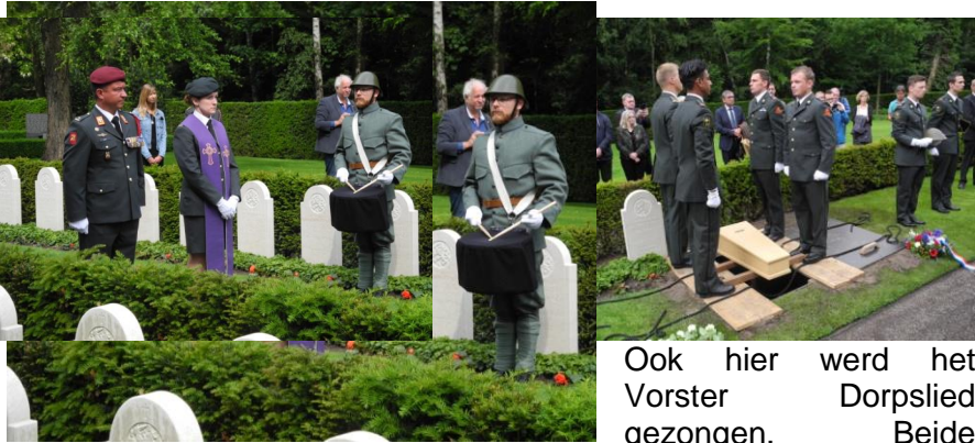
Ook hier werd het Vorster Dorpslied gezongen. Beide

soldaten hadden immers 78 jaar naast elkaar in een graf gelegen op het kerkhof te Broekhuizenvorst en liggen nu ook naast elkaar.