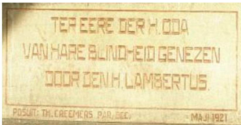
Eerste steen Melderslo 1921.

In de muur van de kerk van Melderslo treffen we twee eerste stenen bij elkaar aan. De oudste en onderste komt uit 1921 en zat oorspronkelijk in de kerk die op de hoek van de Sint-Odastraat, Rector Mulderstraat en Vlasvenstraat stond. Deze kerk is aan het eind van de Tweede Wereldoorlog, op 23 november 1944, door de terugtrekkende Duitse troepen opgeblazen. In 1953 werd een nieuwe en grotere, nog altijd bestaande kerk gebouwd, 150 meter van de oude plek, op de hoek van de Rector Mulderstraat en Lochtstraat. Hier zijn zowel de oude als de nieuwe eerste steen geplaatst.