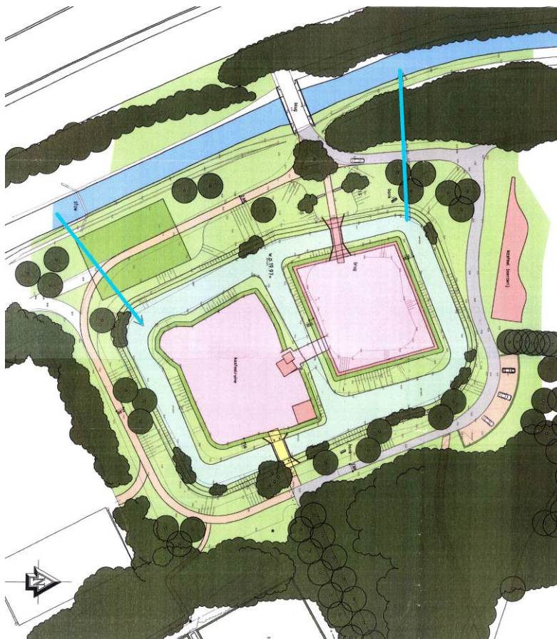
Figuur 1. Ligging van de kasteelruïne en haar directe omgeving

In september 2008 zijn door de gemeente Horst aan de Maas graafwerkzaamheden verricht bij de ruïne van kasteel Ter Horst. De werkzaamheden bestonden uit het maken van een verbinding tussen de noordwesthoek van de huidige kasteelgracht en de Molenbeek, die ter hoogte van de kasteelruïne pal ten oosten van de A73 stroomt. De verbinding bestond uit een duiker. Deze verbinding is een aanvulling op een reeds bestaande verbinding tussen de Molenbeek en de kasteelgracht, die ter hoogte van de zuidwesthoek van de kasteelgracht ligt (figuur 1). Doordat de Molenbeek nu op twee plaatsen verbonden is met de kasteelgracht, kan het water door de gracht stromen. Hierdoor wordt algen groei in de gracht en het dichtgroeien van de gracht met riet en andere waterplanten voorkomen. Hoewel men er logischerwijs van uit kon gaan dat men zo dicht bij de kasteelruïne archeologische resten zou kunnen aantreffen, zijn geen maatregelen genomen om een gedegen onderzoek mogelijk te maken.