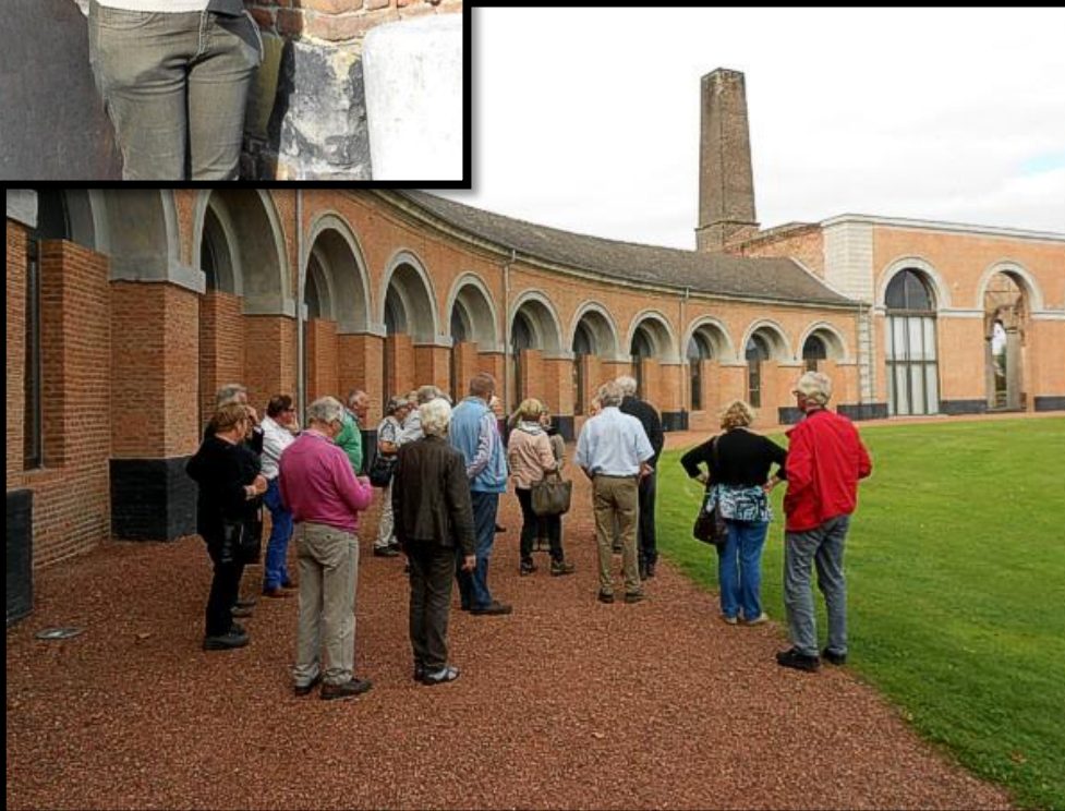
“Le Grand Hornu”