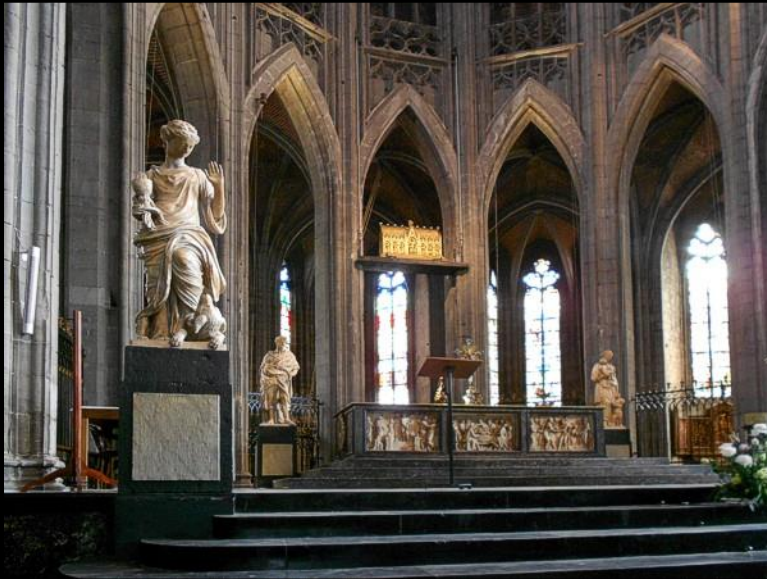
Beelden van Jacques du Broeucq