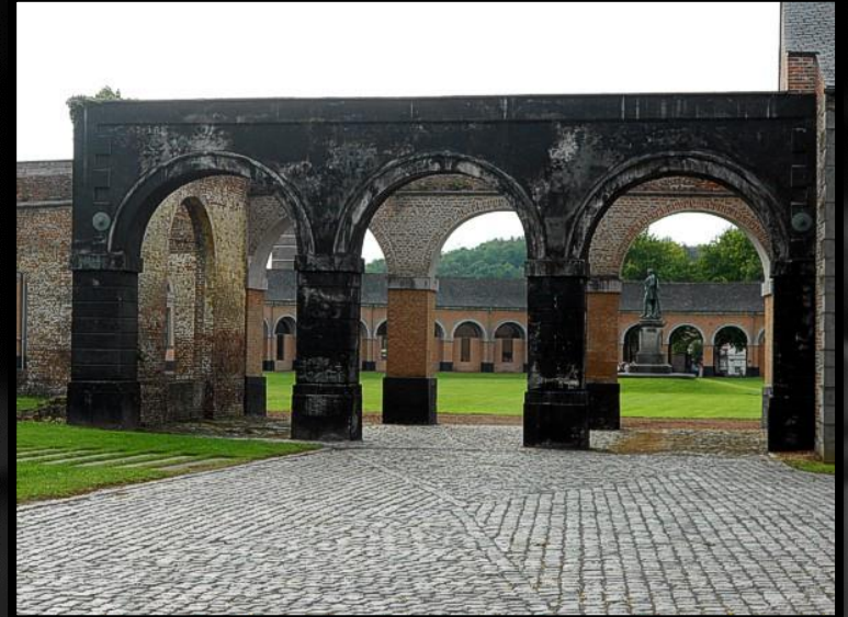
“Le Grand Hornu”