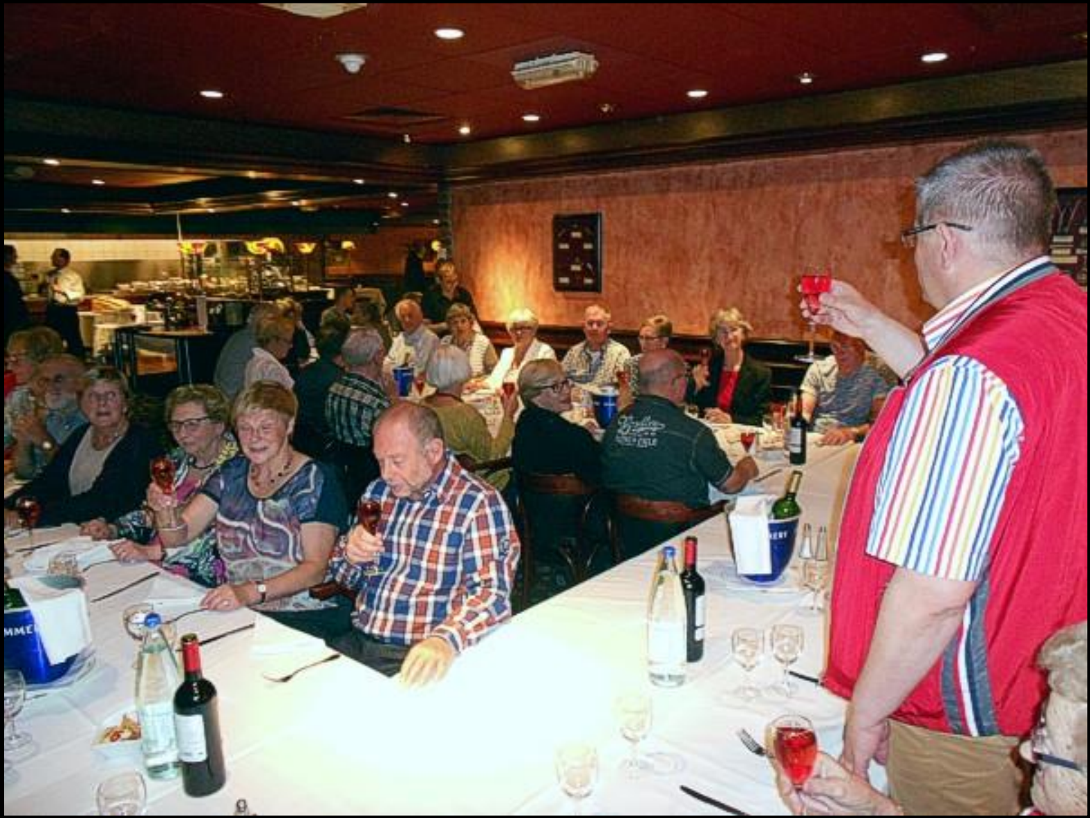
Diner in hotel Mercure Lille Aéroport