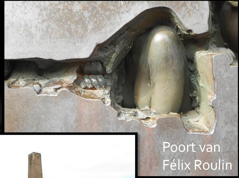
Poort van Félix Roulin